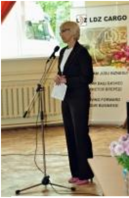
„Latvijas Avīzes” publiskajā diskusijā piedalījās LR Veselības ministre Ingrīda Circene