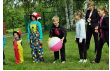
No bērnu un jauniešu programmas

Publicitātes jomā no pagastu bibliotēkām regulāri saņemta, apkopota un sagatavota ievietošanai novada mājas lapā informācija par plānotajiem valsts mēroga un pašu bibliotēku pasākumiem: e-prasmju nedēļu, Bibliotēku nedēļu, Ziemeļvalstu bibliotēku nedēļu, monētu dienām, par konkursu „Pagasta bibliotekārs – gaismas nesējs” u.c.